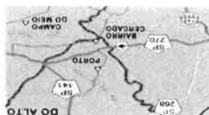
FIGURA PEDÁGIO COBRANÇA UNIDIRECCIONAL / TARIFA BIDIRECCIONAL