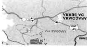
FIGURA PEDAGIO COBRANCA BIDIRECIONAL / TARIFA UNIDIRECIONAL