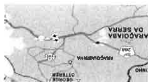
FIGURA PEDÁGIO COBRANÇA BIDIRECCIONAL / TARIFA UNIDIRECCIONAL