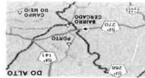
FIGURA PEDAGIO COBRANCA UNIDIRECIONAL / TARIFA BIDIRECIONAL